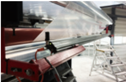
iONstream 4.0 iONcharge 4.0 iONcontrol